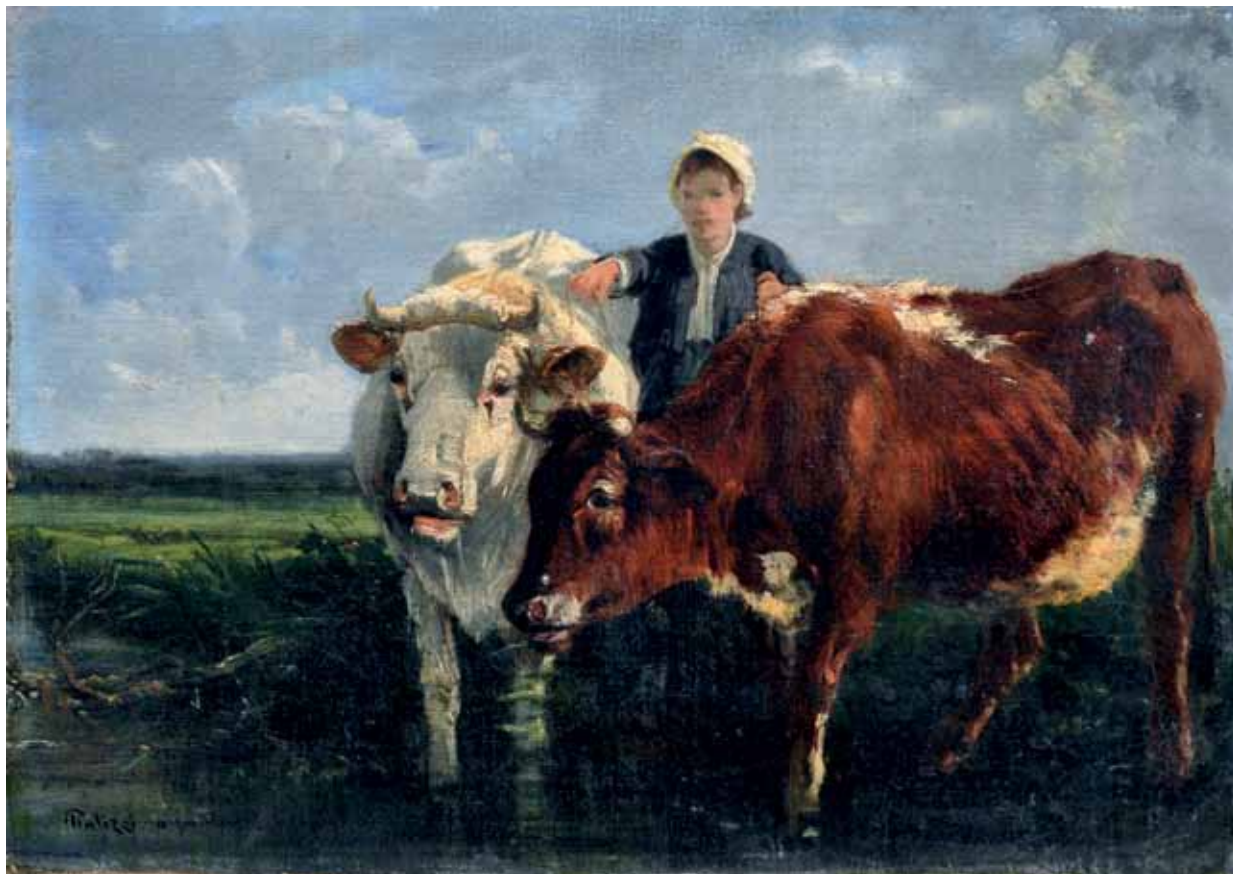
106 PALIZZI GIUSEPPE (Lanciano, CH 1812 - Passy 1888) Mucche olio su tavola, cm 27x38 firmato e iscritto in basso a sinistra: Palizzi ... Stima: € 3.500/5.500