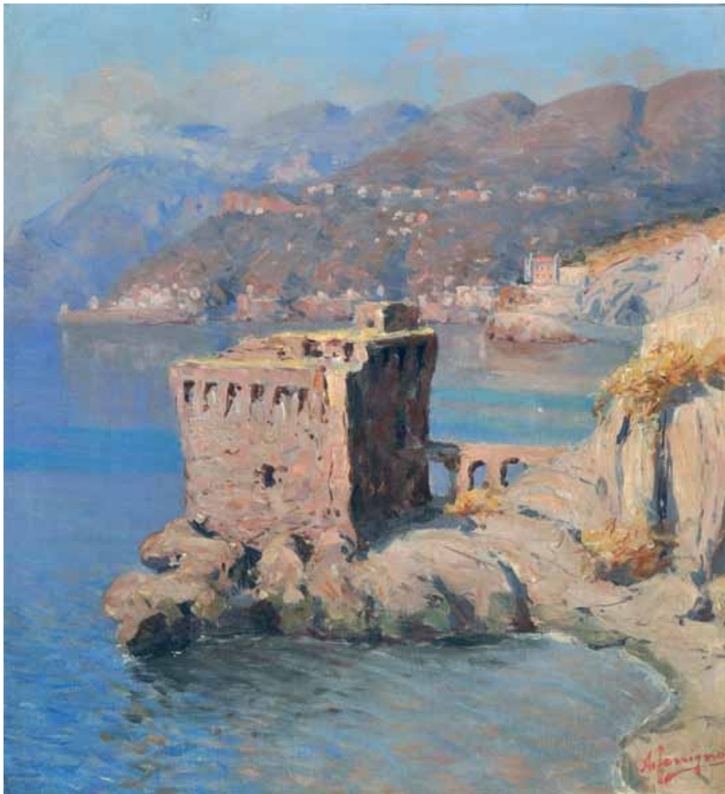
36 FERRIGNO ANTONIO (Maiori, SA 1863 - Salerno 1940) Paesaggio costiero olio su tela, cm 56x50 firmato in basso a destra: A. Ferrigno Stima: € 3.500/4.500