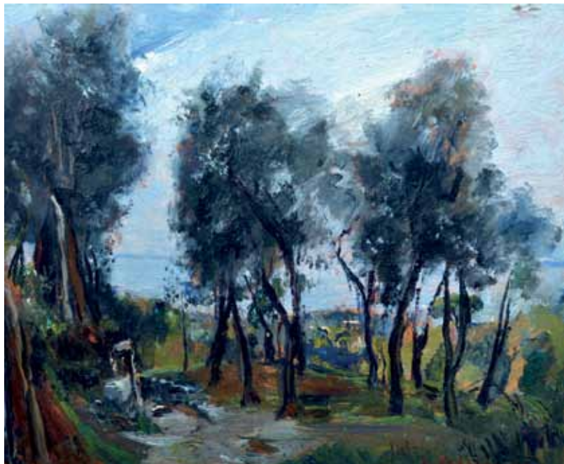
43 CRISCONIO LUIGI (Napoli 1893 - Portici, NA 1946) Paesaggio alberato olio su tavola, cm 26x31,5 firmato in basso a destra: L. Crisconio Stima: € 750/1.250