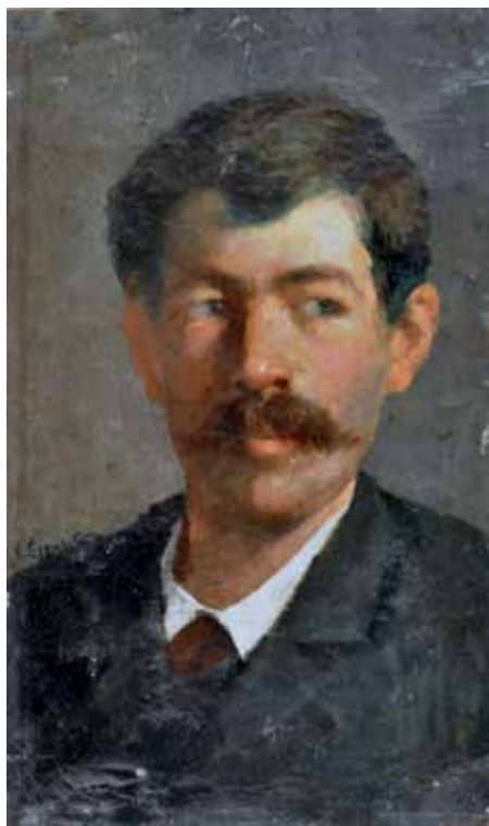
96 STAGLIANO ARTURO (Campobasso 1870 - Torino 1936) La sua modella olio su tavola, cm 35x24,5 firmato in basso a sinistra. A. Stagliano Stima: € 1.200/2.400