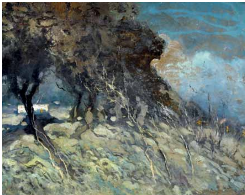
24 CASCELLA MICHELE (Ortona, CH 1892 - Milano, 1989) Paesaggio olio su tela, cm 60x75 a tergo firmato e datato: Michele Cascella 908 Autentica su foto della figlia Stima: € 1.000/2.000