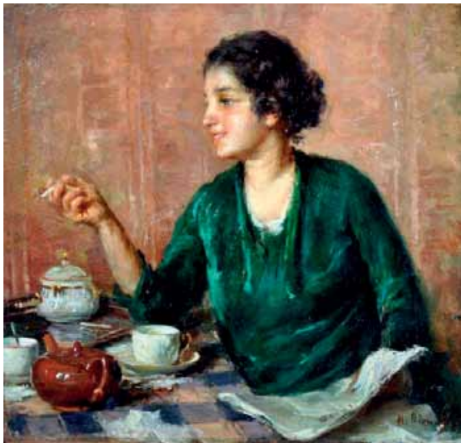
98 BIONDI NICOLA (Capua, CE 1866 - Napoli 1929) L'ora del the olio su tela, cm 33x34 firmato in basso a destra: N. Biondi Stima: € 1.200/2.400