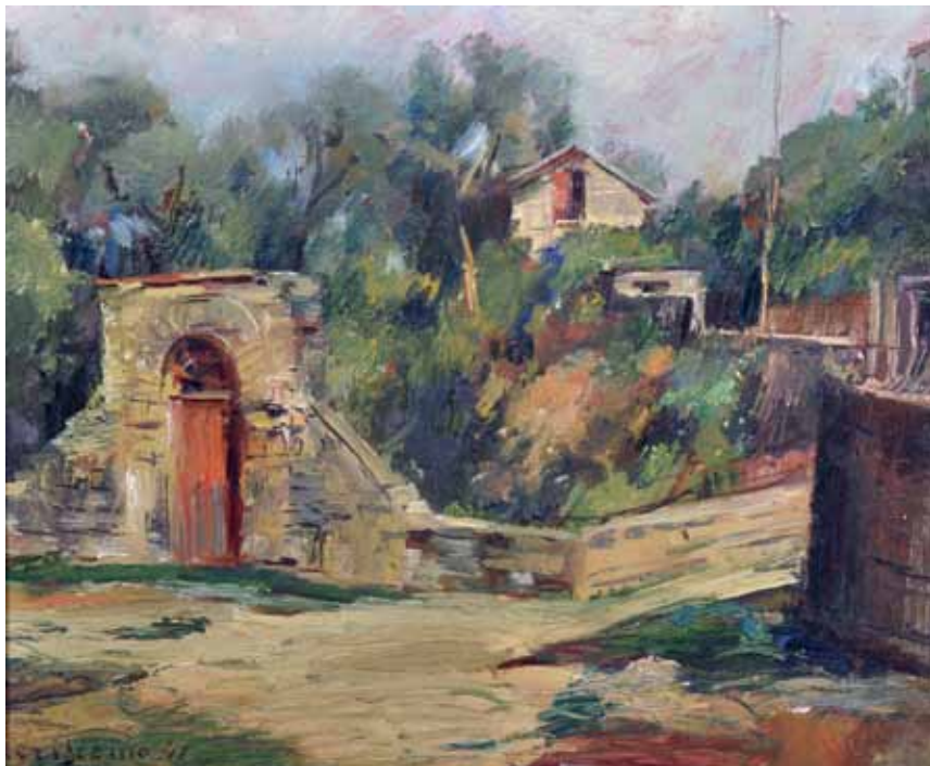
45 CRISCONIO LUIGI (Napoli 1893 - Portici, NA 1946) Paesaggio olio su tavola, cm 26x30 firmato e datato in basso a sinistra: L. Crisconio 41 Stima: € 750/1.250