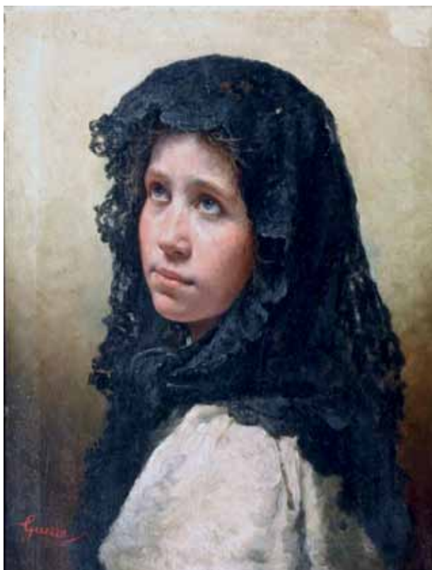
99 GUERRA ACHILLE (Napoli, 1832 - Roma, 1903) Ritratto femminile olio su tela, cm 40x31 firmato in basso a sinistra: Guerra Stima: € 1.300/2.600