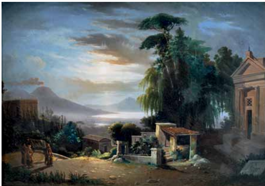
95 SCOPPA RAIMONDO (Napoli 1820 - dopo il 1890) Dai Camandoli olio su tela, cm 46,5x68 firmato e datato in basso a destra: R. Scoppa 1850 Stima: € 2.500/4.500