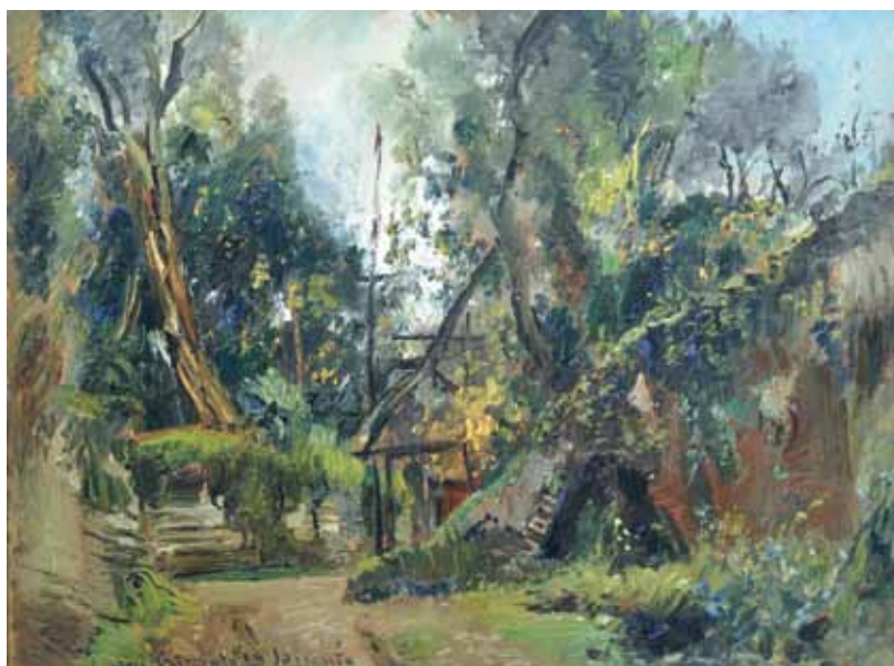
44 CRISCONIO LUIGI (Napoli 1893 - Portici, NA 1946) Strada a Sorrento olio su tavola, cm 29,5x39,5 firmato, datato e iscritto in basso a sinistra: Luigi Crisconio 39 Sorrento Stima: € 1.000/1.500