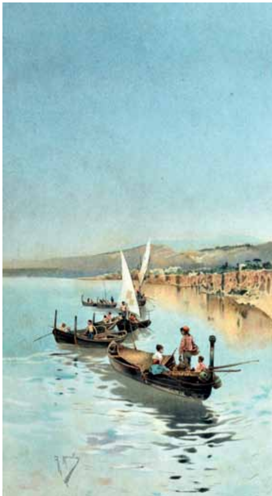
56 MAINELLA RAFFAELE (Benevento 1856 - Lido di Venezia 1941) Pescatorello acquerello su carta, cm 30x17 firmato in basso a sinistra: R. Mainella Stima: € 650/1.250