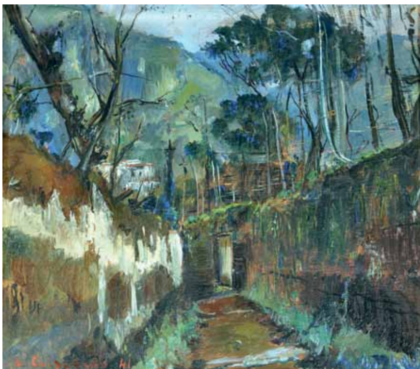
46 CRISCONIO LUIGI (Napoli 1893 - Portici, NA 1946) Strada di Meta olio su tavola, cm 29,5x33 firmato e datato in basso a sinistra: L. Crisconio 41 Stima: € 1.000/1.500