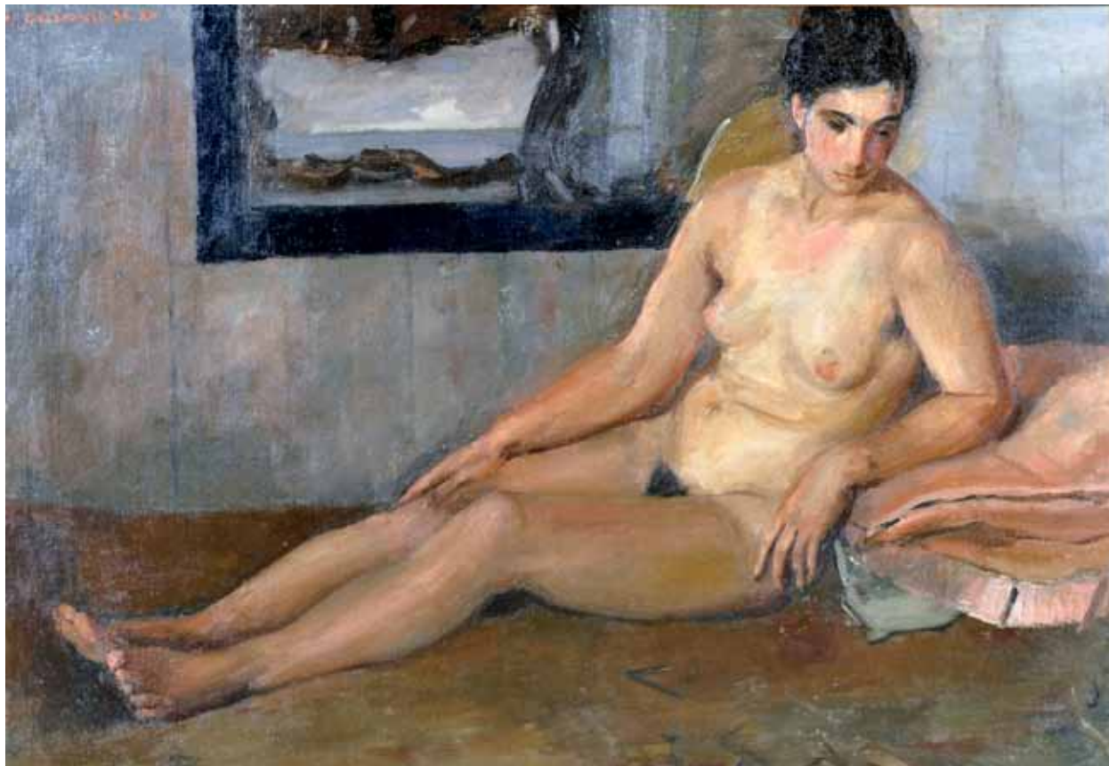
49 CRISCONIO LUIGI (Napoli 1893 - Portici, NA 1946) Nudo femminile olio su tela, cm 44x125 firmato e datato in alto a sinistra: L. Crisconio 34 XII Stima: € 4.000/7.000