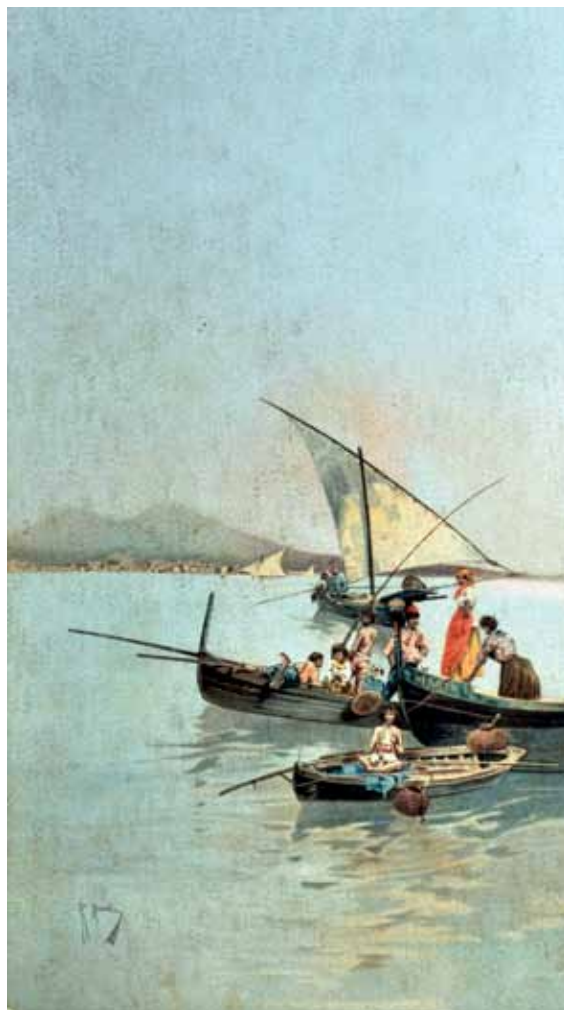
54 MAINELLA RAFFAELE (Benevento 1856 - Lido di Venezia 1941) Pescatori acquerello su carta, cm 30x17 firmato in basso a sinistra: R. Mainella Stima: € 650/1.250